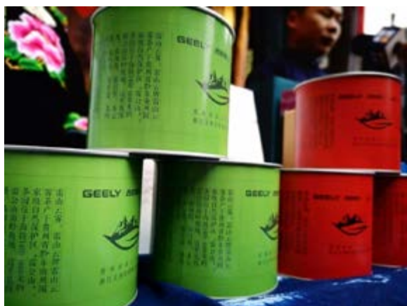
雷山 - 云尖茶