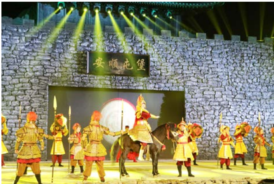
《大明屯堡》实景史诗剧

为了推动夜经济，各地方政府也是不遗余力地出台相关政策促进夜间消费。2019年，北京出台13条具体措施，进一步繁荣夜间经济；上海设立“夜间区长”“夜生活首席执行官”，进一步优化夜间营商环境；天津提出打造“夜津城”，2019年底形成6个市级夜间经济示范街区；南京提出到2020年，力争夜间经济试点区域新增经营收入占全市社会消费品零售总额的比重达到4%左右；成都出台加快建设国际消费城市行动计划，明确提出挖掘夜间消费新动能；贵州贵阳以市西路滨河商业街、南明河城市旅游文化休闲带等为中心，大力引入购物、酒吧、书店、剧院、网咖等既对接传统生活，着力打造夜间消费市场；贵州安顺《大明屯堡》实景史诗剧给夜经济增添文化气息。