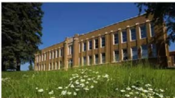
College of Education & Human Service Professions (CEHSP)

为此，华兴教育集团联合明尼苏达大学（美国）、圣约翰圣本尼迪克大学（美国）、多伦多大学（加拿大）、圣安德鲁斯大学（英国）、巴黎政法大学（法国）、悉尼大学（澳大利亚）打造海外留学项目，通过真实经历多元文化，开阔学生视野，培养独立思考和坦然面对挫折的信念，帮助年轻人用更全面的眼光了解人性和社会，形成完整的人生观、世界观和价值观。