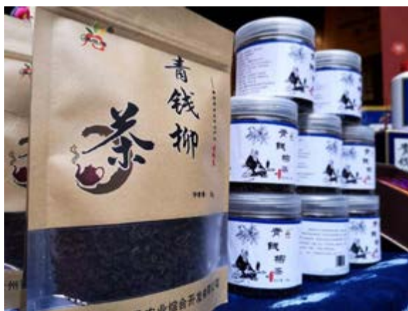
雷山 - 青钱柳