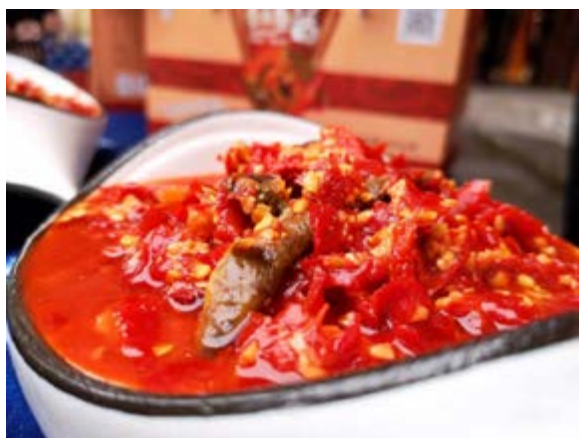
雷山 - 鱼酱酸