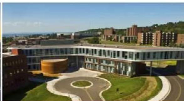
Labovitz School of Business & Economics (LSBE)