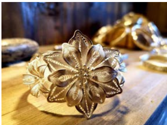
雷山 - 银饰小饰品