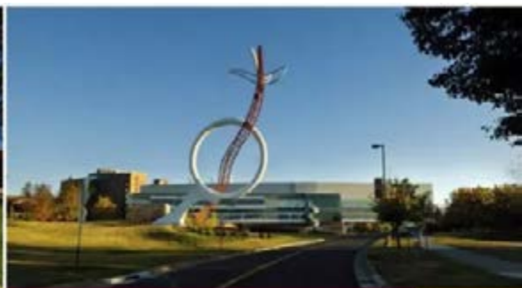
Swenson College of Science & Engineering (SCSE)