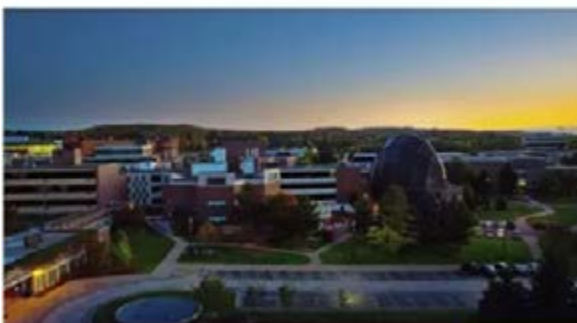
College of Liberal Arts (CLA)